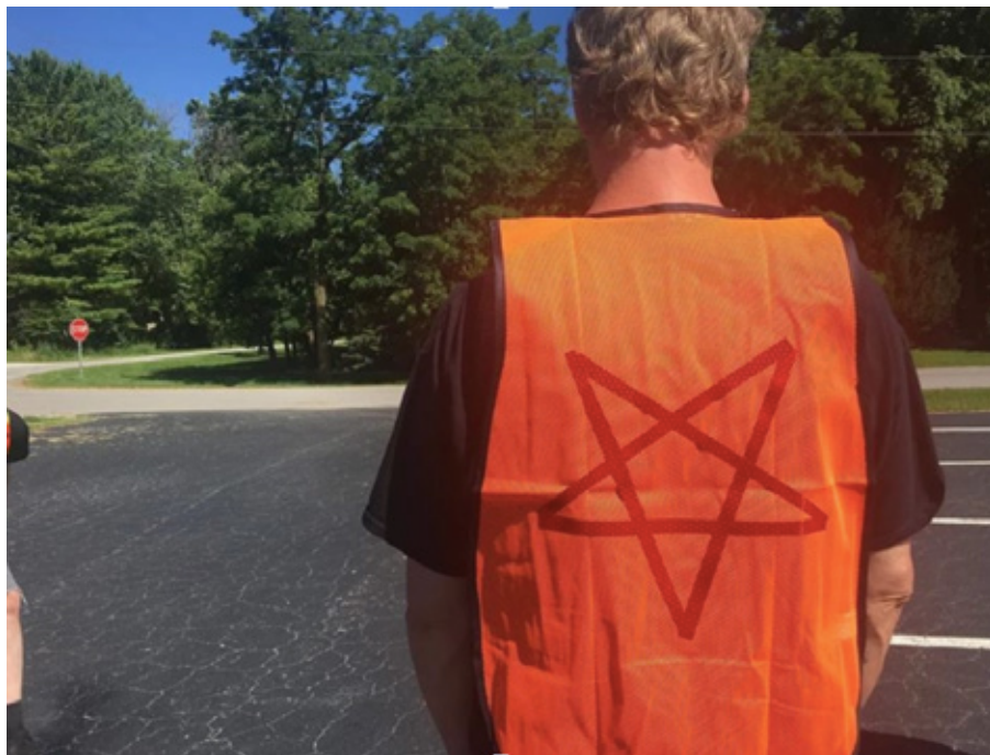
Obr. 1. Člen Satanova chrámu uklízí odpadky u dálnice ve státě Indiana. Přetisk z May – Mack 2018.

(Carmina 2021). Boj za zvířecí práva a ekologii jsem našel také ve zprávách o jisté jihoafrické satanistické organizaci (Bullen 2020). A existují minimálně dva vlivné účty na Instagramu, které kombinují satanismus s ekologickým stylem života a veganstvím (jde o @hail.vegan a @modern_satanic_vegan ). To vše mě vedlo k tomu, abych provedl terénní výzkum se členy dvou nejdůležitějších českých satanistických organizací a pokusil se zjistit, zda se i u nich se objevila ekologická a environmentální témata.