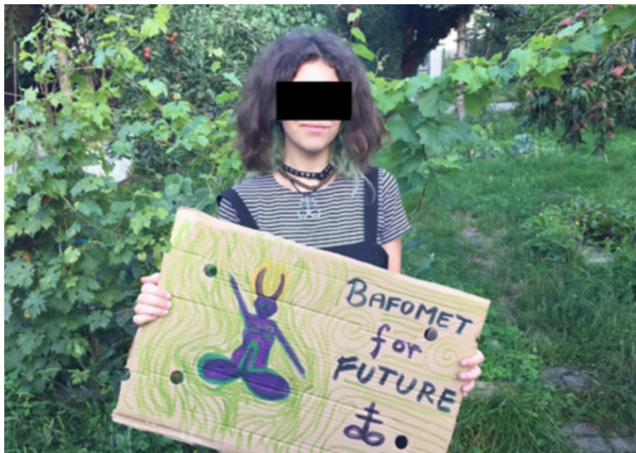
Obr. 4. Členka Satanovy komunity s vlastní modifikací názvu ekologických manifestů Fridays for future ; tvář zakryta s ohledem na soukromí dané osoby.