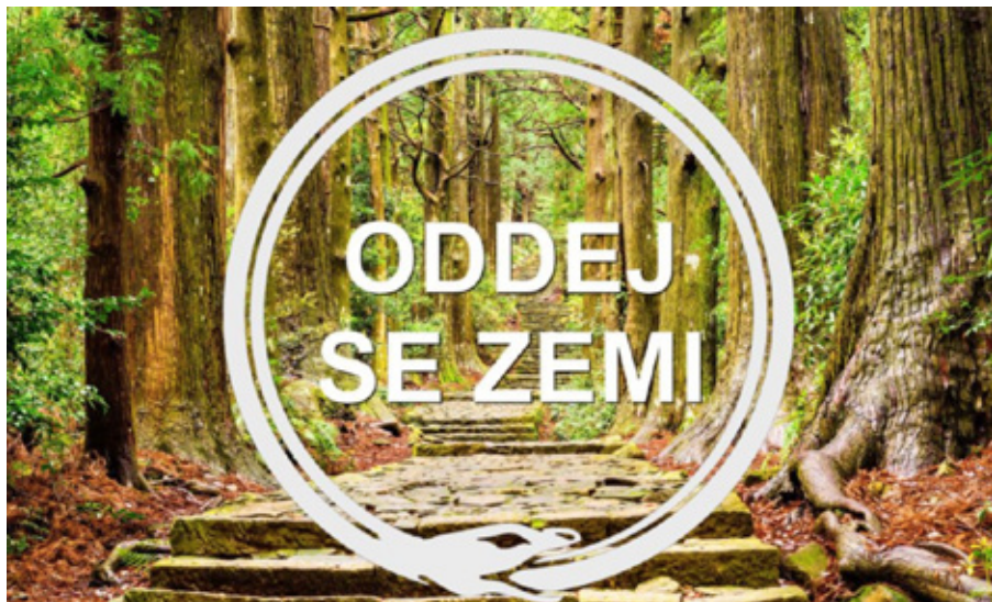
Obr. 5. Plakát s holistickým učením Satanovy komunity, který byl doplněn textem: „Země nás zrodila. Země je naše svatyně. Země je místem našeho ráje. Země je naší láskou a cílem našich tužeb, proto se neváhej duchovně milovat se Zemí. Oddej se jí, tělem i duší. Nadčlověk budiž smyslem země! Objev v sobě slávu Přírody!“ Přetisk z: Satanova komunita 2020 , Nauka Satanovy komunity 7, Nadčlověk je smysl země.

hnutí integrovalo ekologické tendence po svém. Zatímco u novopohanských uskupení stále převažuje antropocentrický pohled, u holistického přístupu Satanovy komunity dochází k posunu směrem k hlubinné ekologii a biocentrickému postoji (příkladem může být i Obr. 5).