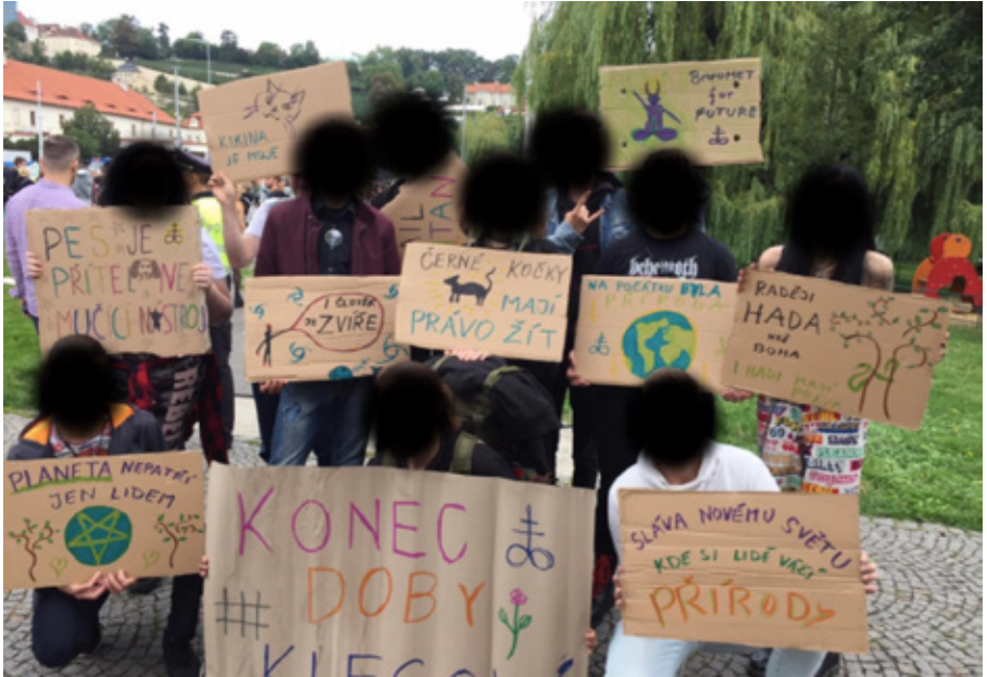
Obr. 2. Členové Satanovy komunity na pochodu za práva zvířat v roce 2019. tváře byly zakryty s ohledem na soukromí daných osob.

k ochraně životního prostředí mít nějaký vztah a měl by se snažit něco změnit. Z těch členů, které znám, mohu říct, že většina z nich k ní vztah opravdu má“ (Rozhovor s respondentem Satanovy komunity 1, 2021). Jeden z respondentů dokonce použil termín „zvířecí sourozenci“, aby označil příbuznost mezi lidmi a zvířaty ve vztahu k filosofii Satanovy deklarace o přírodě . Souvztažnost mezi lidmi a zvířaty či stromy se objevila v rozhovorech několikrát: „Vztah s přírodou je základním aspektem satanismu. Člověk je vlastně zvíře, a zvířata jsou zase tvorové, kteří mají duši, podobně jako člověk. I stromy mají určitý druh duše. Vlastně celá příroda má satanskou povahu, která se bouří proti omezením a pravidlům, se kterými přichází monoteistické náboženství“ (Rozhovor s respondentem Satanovy komunity 2, 2021).