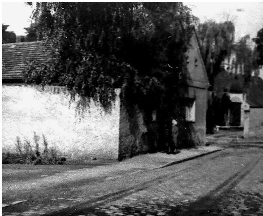
Zaniklá modlitebna Církve československé (husitské) na Chodově. Foto J. David, asi 1967.

už je zase skoro deset minut po deváté.“ – „Ale už jde.“ – „Tak si pojdme sednout.“ Všichni už sedí a její malá dcerka přichází. Od své sousedky se dozvídám, že paní farářka je rozvedená a děti má tři. Holčička vstává z lavice a utíká do vedlejší místnosti k mamince, která se tam převléká do taláru: „Mami, tak už pojd!“ Maminka jde. Je to silná, zdravá, hezká mladá žena.