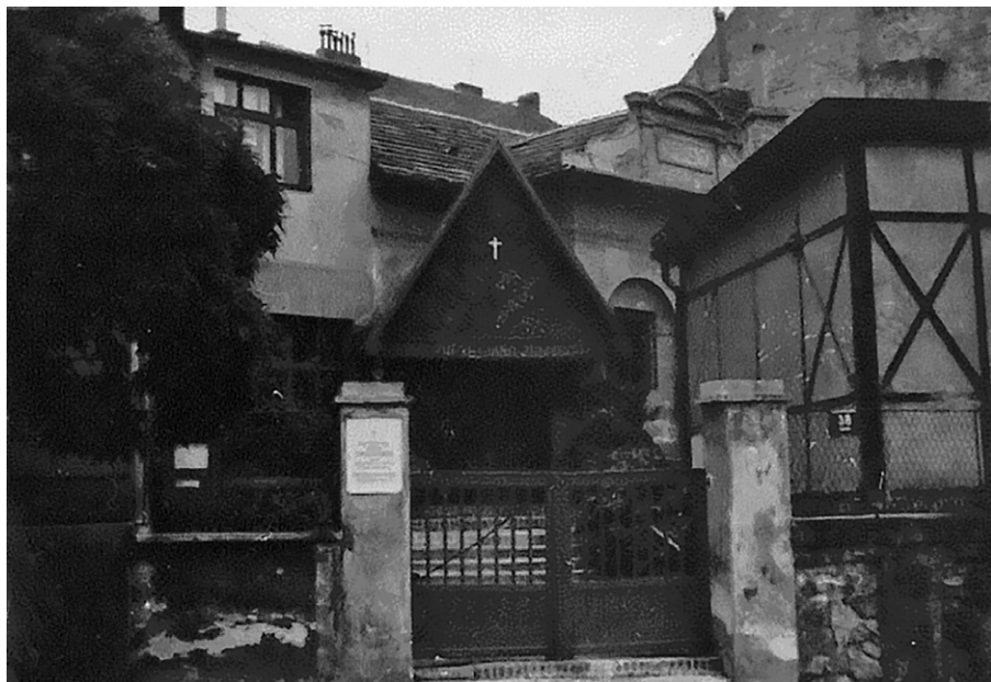
Sbor Jana Želivského Církve československé (husitské) na Břevnově vznikl adaptací bývalé konzervárny. Foto J. David, asi 1967.