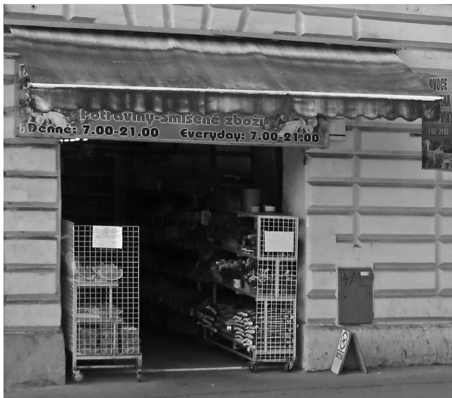
Současný stav bývalého košířského sboru – po opuštění prostor ČČSH byly pronajaty jako vietnamská tržnice. Foto Z. R. Nešpor, 2021.

V našem životě je mnoho věcí, mnoho událostí, které normální lidé nazývají náhodou. Nač přemýšlet o tom, co se děje, co se prostě stane s naším očekáváním a bez našeho přispění. Náhoda – a je to odbyté. Snažme se zamyslet nad takovými událostmi, jako je ta, že vůbec žijeme, že se narodí dítě, cožpak je tak samozřejmé, že se narodí zdravé dítě? Což je samozřejmé, že strom napřed rozkvetne a potom má ovoce? To jenom my jsme tak zobyčejněli, že takové věci už nevidíme, nebo je považujeme za samozřejmou obyčejnost. Ale v našem všedním životě je mnoho příhod a dějů a i docela malých věcí, které jsou stejně neuvěřitelné, jako je neuvěřitelný rozkvetlý strom. Sejdou se dva cizí lidé, začne mezi nimi láska, která je neuvěřitelná stejně tak, jako jistoty, kterou oni dva vytvoří. Jen zkuste s někým mluvit o neuvěřitelných věcech! Co řekne? Blbost.