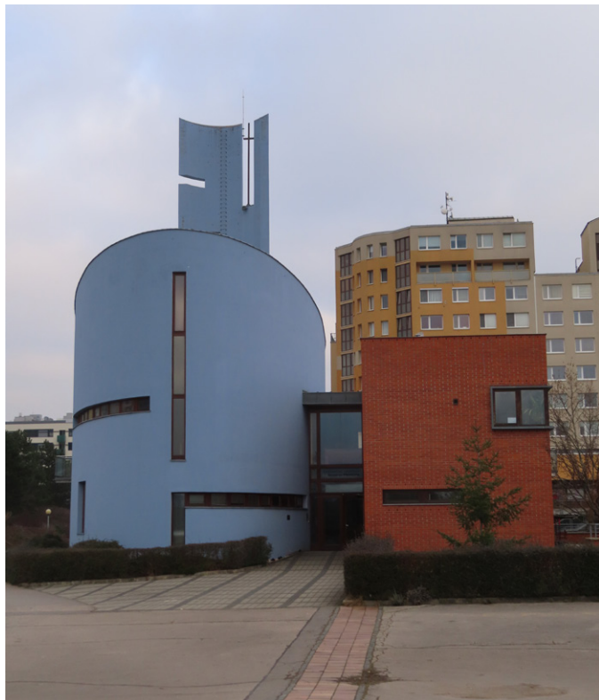
Butovice, respektive nedaleké sídliště Nové Butovice, získaly v novém tisíciletí také nový kostel sv. Prokopa, přiléhající ke stejné zasvěcenému komunitnímu centru. Autorský kolektiv jedné z mála chrámových novostaveb současnosti vedl Zdeněk Jiran, stavba byla realizována v letech 2000–01. Foto Z. R. Nešpor, 2023.

(Mat[ouš] 5, 20–24), zvláště pojem oltáře. U Židů i u křesťanů původně prostý stůl jako ve večeřadle, později mnoho ozdob, ztrácel se smysl. Nyní opět prostý stůl. A co máme přinášet na oltář? Ne krev zvířat, ne svou krev, ale hlavně svá předsevzetí. Máme trpělivě snášet příkoří a napřít své síly na špatnosti vlastního života. Všichni křesťané jsou vlastně kněžími a i mše je obětí nás všech. Hovoří spatra, hlasem malinko zastřeným a s jistotou, která člověka nutí ke spánku. Je to jistě inteligentní a krásný projev bez stylistické chyby a s dobrými myšlenkami. Jemné vystupování, malinký úsměv. Nic neruší dokonalou pohodu. Ale oč živější jsou ptáčci, kteří se právě v nejlepším usadili na mřížích okna a hašteří se!