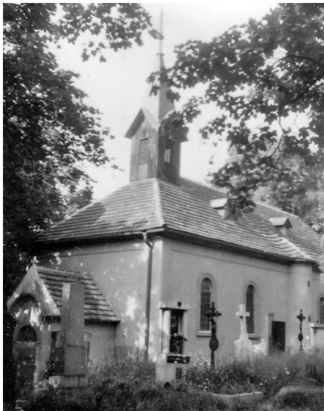
Butovický hřbitovní kostel sv. Vavřince, pocházející snad z 11. století a výrazně přestavěný na konci století 19., zůstal do současnosti prakticky nezměněn. Foto J. David, asi 1967.