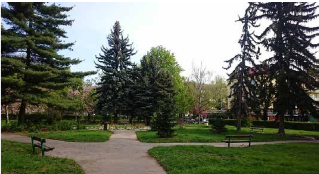
Využívaná část centrálního parku na Solidaritě (naproti divadlu). Foto: Tereza Hodúlová, 2018.