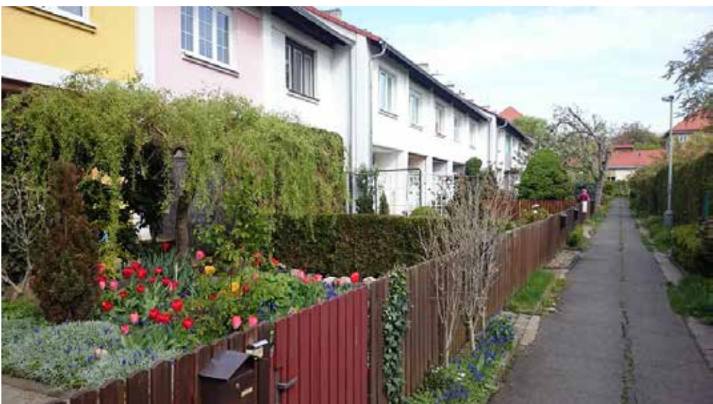
Oplocené předzahrádky. Foto: Tereza Hodúlová, 2018.