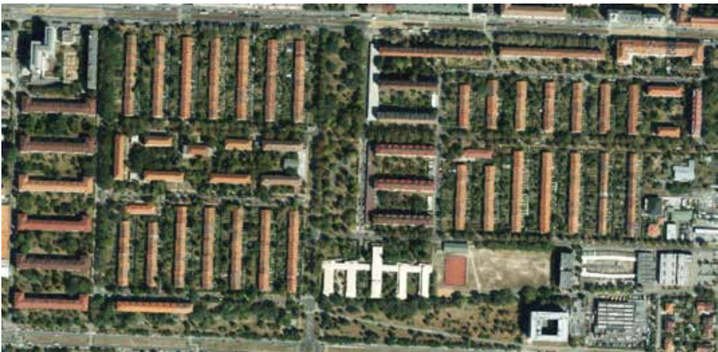
Sídlíště Solidarita, 2019.

stavebních technologií, družstevní formy financování a kolektivního přístupu k bydlení hledala ideální model bytové výstavby (l. c.).