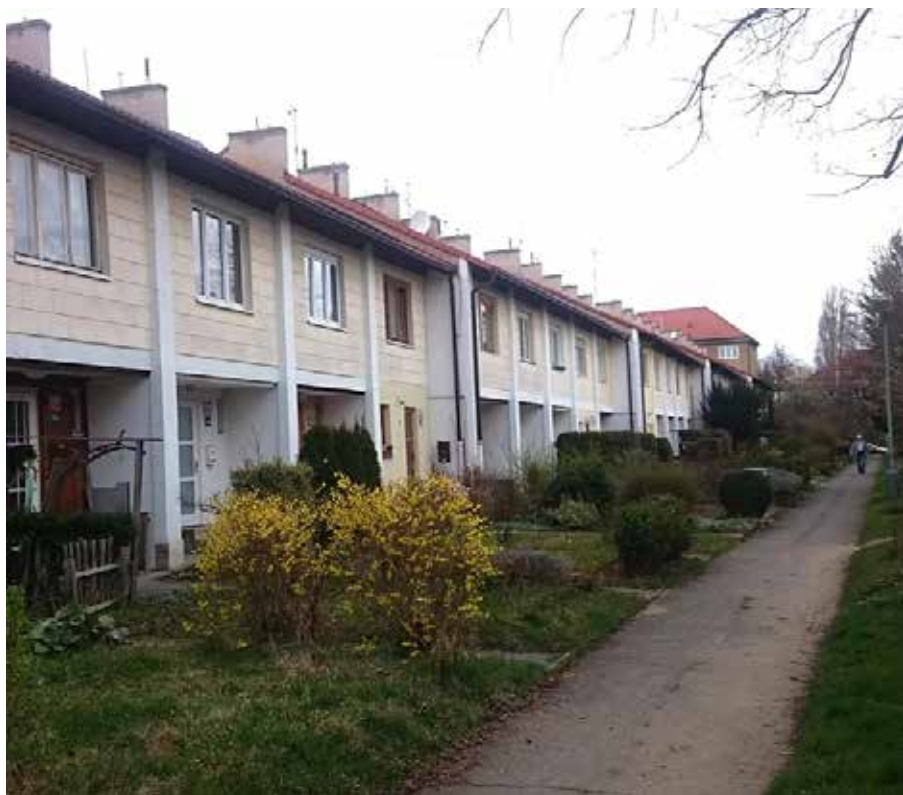
Jedna z posledních řad, která dodržuje původní návrh bez plotů.