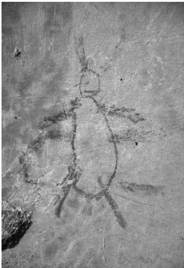
Zámek Litomyšl – dětská kresba v mezipatře objektu, pravděpodobně ze sedmdesátých let 20. století. Foto: L. Bartůňková, 2016.

pěti vyobrazených struků klečí člověk se zdviženými pažemi, sající mléko. Lze předpokládat, že se jedná o hanlivý vizuální motiv tak zvané Judensau , tedy „židovské svině“, který má velmi dlouhou tradici. Nejstarší zobrazení pochází ze 13. století. Jde o antisemitské zobrazení židů v obscénním kontaktu se sviní. Židé obcují se sviní, případně sají mléko obří svině. Vepři jsou v rámci judaismu považováni za rituálně nečistá zvířata. Motiv židovské svině byl velmi rozšířen zejména v sakrálních stavbách na území Německa (Tydlitátová et al. 2013). Judensau se objevuje v knižních ilustracích, ale i v sochařství a architektuře. Známa jsou středověká vyobrazení v sakrálních stavbách, kde se Judensau vyskytovala v podobě chrlice či jako kamenný reliéf, například