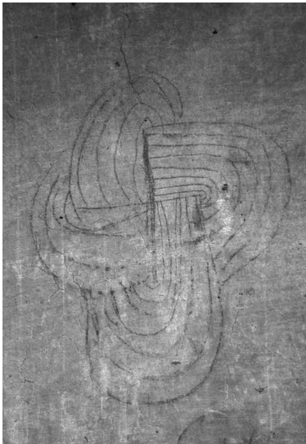
Zámek Litomyšl – kresba v mezipatře objektu na renesanční omítkové vrstvě, tzv. Šalamounův uzel.

uzavřených smyček, které se prolínají. Šalamounův uzel bývá nazýván také jako „svastika – Pelta“. Ve středověku přetrvávala víra, že zástupná kresba labyrintu slouží coby past na zlé duchy.