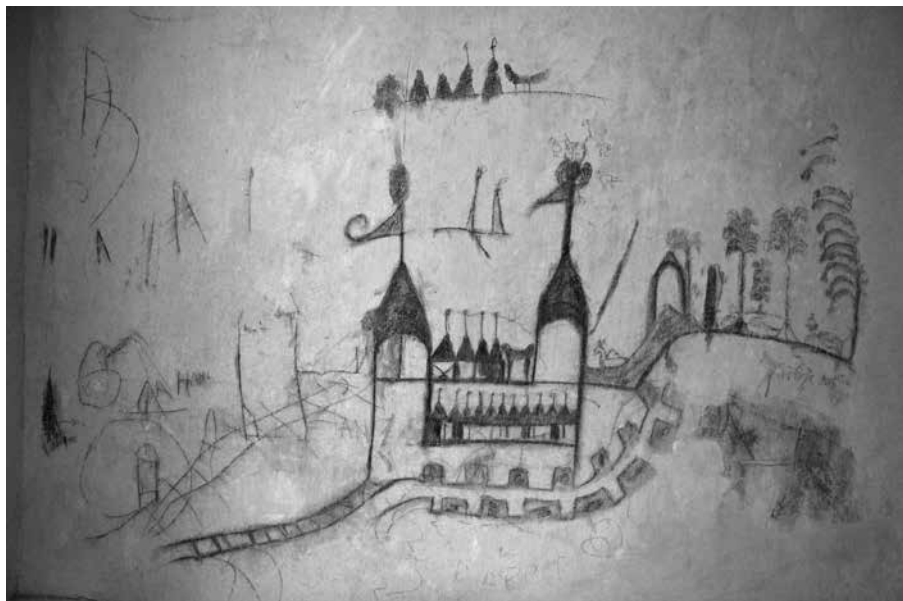
Zámek Prostějov – graffiti na renesanční omítkové vrstvě, patrně kresba zámeckého objektu.

historických spontánně motivovaných kreseb častý námět monogramu Ježíše Krista IHS. Symbol IHS je zde vepsán do kruhu a v jedné kresbě dokonce do méně často zobrazovaného slunce, tak zvaného bernardinského slunce podle Bernardina ze Sieny (Royt 2007: 140). Monogram Ježíše Krista lze nalézt na zdech takřka každého objektu z renesančního či barokního období, ať již profánního, či sakrálního.