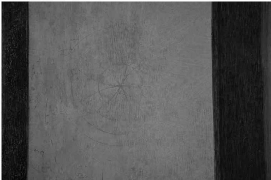
Zámek Prostějov – kružítková kresba.

a na těžce hladké půdě (omítce) dole ve schodišti. Snad jest to primitivní nákras bývalého zámku“ (ibid.). Další obdobný nález skici budovy, avšak v menším měřítku, byl nalezen v nedávné době ve druhém nadzemním podlaží v sále, kde aktuálně probíhají restaurátorské práce na renesančních nástěnných malbách. Velmi tenkou rytou linkou je zde znázorněna budova s věží, vstupní branou a okny s hvězdami. Brána a věž a bání na věži jsou zdůrazněny červenou barvou odlišného charakteru, než kterým jsou provedeny nástěnné malby. Určitě se však nejedná o rudku, ale snad o tenkou vrstvu pečatního vosku či organického barviva (krve?). Složení materiálu by však bylo možné přesně určit pouze pomocí chemicko-technologického průzkumu. V blízkosti kresby se nachází velké množství filigránsky provedených textů (vyrytých velmi tenkým, ostrým předmětem), především zkratk a latinských slov.