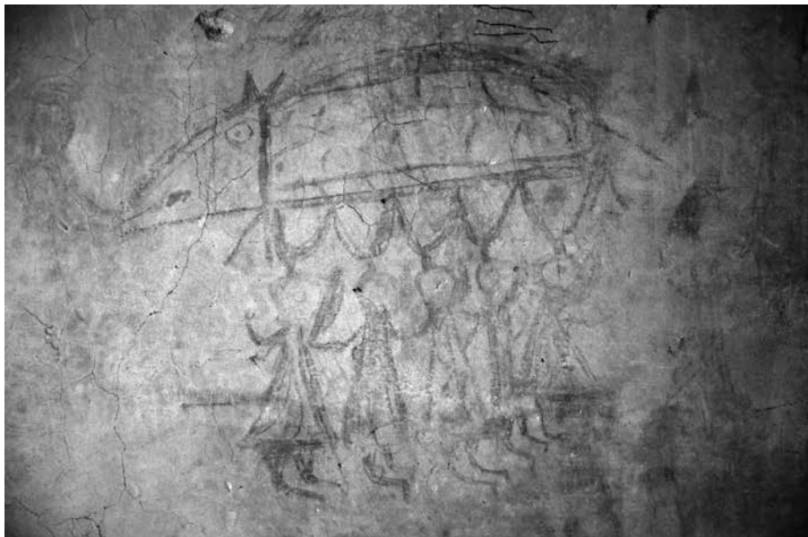
Zámek Litomyšl – kresba v mezípatře objektu, hanlivá karikatura tzv. Judensau.

Další prostory s bohatou škálou spontánně motivovaných nápisů a kreseb na litomyšlském zámku jsou půdní prostory. Opět zde zaznamenáváme použití různorodých nástrojů a zobrazení rozličných motivů. Rozsáhlé plochy zdí podkrovních prostor podněcují svou „prázdnotou“ k tvůrčí činnosti, a proto se setkáváme i s rozměrnými kresbami figur, patrně spíše mladšího data. Postavy jsou většinou stylizované do podob rytířů, v jednom případě se jedná o ženu s čepcem držící v rukou patrně nůžky nebo jiný nástroj podobného charakteru a další z figur je pak zcela fantazijní. Představuje neforemného tvora s velkým nosem, na němž stojí obdobný tvor v menším měřítku. Mnoho nápisů bylo provedeno řemeslníky, kteří v objektu v průběhu dvacátého století pracovali, především pak na opravách krovu a střechy. V tomto případě se jedná většinou o hanlivé nápisy a kresby s erotickou tematikou. Nechybí samozřejmě podpisy řemeslníků s datacemi, z nichž jedna z nejmladších velkoformátových datací spadá do roku 1961, kdy se zde podepsali klempíři a pokrývači.