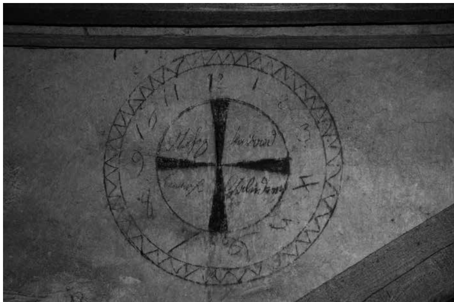
Zámek Litomyšl – graffiti v podkroví objektu, kresba ciferníku s nápisy v kurentu. Foto: L. Bartůňková, 2016.

v dómu v Regensburgu, Brandenburku, Magdeburku a jinde. V antisemitické propagandě se vyskytuje až do 20. století. Kresby podobného způsobu provedení se vyskytují i v podkrovních prostorách zámku a lze tedy uvažovat o tom, že autorem byl některý z řemeslníků, který se podílel na opravách zámku a byl ubytován v jedné ze světnic v mezipatře. Rovněž předpokládáme, že zde zobrazený námět Judensau bude pocházet patrně z devatenáctého či z první poloviny 20. století, kdy se tento motiv v českém prostředí objevuje v antisemitické karikatuře. 12