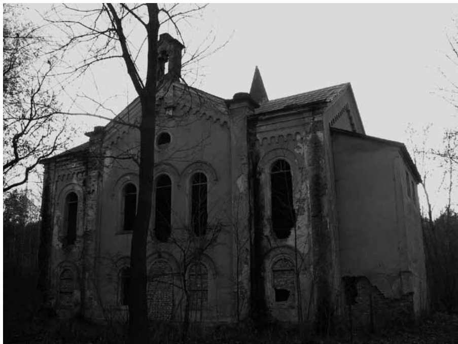
První evangelický sborový dům byl postaven v Růžové (Rosendorf) v letech 1863–1864. V padesátých letech 20. století sloužil jako kino (v přístavku napravo byla umístěna promítací kabina), dnes zpustlý. Foto Z. R. Nešpor, 2009.

tem z 3. srpna 1945 žádal jednotlivé místní národní výbory o zajištění příslušného majetku, o jehož dalších osudech mělo teprve rozhodnout ministerstvo školství a osvěty.