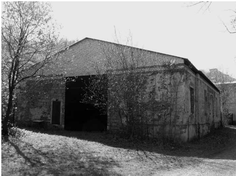
Kostel ve Vraclávku (Klein-Bressel) z roku 1828. Po zániku NEC došlo k ubourání věže a částečné „přestavbě“, stavba nadále sloužila jako truhlárna a garáž, dnes sklad. Foto Z. R. Nešpor, 2009.

užívání bohoslužebných prostor po Německé evangelické církvi. Jinde si jejich užívání/zisk sice nárokovala, nicméně situace v praxi často odpovídala tomu, z čeho „čechoslováci“ rétoricky obviňovali evangelíky: potenciální účastníci bohoslužeb byli „naháněni“ na ulicích, věřící byli do náboženských obcí zapisováni čistě formálně, to vše proto, aby církve mohla prokázat své nároky. Nepřekvapivým důsledkem byla slabost a rychlý zánik většiny náboženských obcí Církve československé v někdejší pohraničí, na tomto úpadku se ovšem podílely také další důvody (celospolečenská sekularizace, antiklerikalismus komunistického režimu aj.).