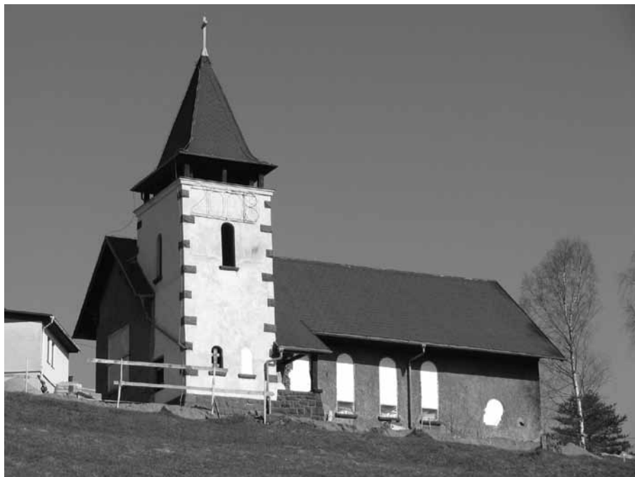
Poslední (nedostavěný) kostel NEC v Dolní Poustevně (Niederinsiedel), jehož základní kámen byl položen v roce 1938. Po odsunu Němců devastovaný, od roku 2008 přestavovaný na městský klub. Foto Z. R. Nešpor, 2009.

evangelická církev byla většinovým uživatelem, její sbory si v dotaznících opakovaně stěžovaly na neochotu Československé církve jakkoli přispívat na případné opravy (nebo i prostou údržbu) nově získaných budov, ať již šlo o chrámy a fary spoluužívané, nebo užívané výhradně touto církví. Příklad z Rumburka: Církev československá „Neopravila nikde nic! V ničem nám nepomohla, ale přišla vždycky do hotového, a nezeptali se ani jednou: Co vám máme dát?“ Výjimečně sice mohlo dojít i ke shodě na místní úrovni, představitelé obou církví se však obvykle vnímali jako konkurenti, a to i v symbolické rovině, tím spíše pak v rovině ekonomických starostí o vznik a další fungování příslušných náboženských obcí. Třebaže přitom můžeme stát spíše na stanovisku Česko-bratrské církve evangelické, která na nemovitosti Německé evangelické církve měla přinejmenším větší morální nárok, neznamenalo to v žádném případě