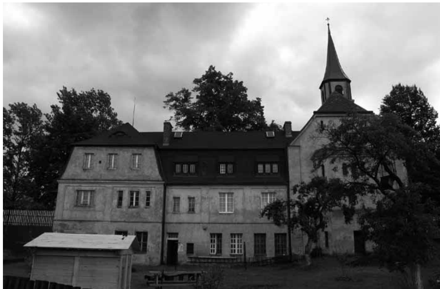
„Lutherův hrad“ – sborový dům v Novém Městě pod Smrkem (Neustadt an der Tafelfichte), dílo O. Bartninga z let 1911–1912. Od zániku NEC sídlo sboru ČCE, v současnosti rekonstruované.

významnou evangelickou denominací v českých zemích. Evangelíky z řad neodsunutých Němců a těšínských Poláků přitom ovšem vítala i pozitivním krokem, připojením augsburské a druhé helvetské konfese – jichž se čeští evangelíci vzdali v revolučním nacionálním nadšení po vzniku Československa – ke svým stávajícím oficiálním vyznáním (českému z roku 1575 a bratrskému z roku 1662). Jak uváděl Boháč, svým „sjednocením na základě české a bratrské konfese ... se [čeští evangelíci] nijak nevzdali spojení s církvemi světového protestantismu, vzešlymi z reformace husitské a kalvínské “ (ibid.: 31; kurzíva dodána: uvádět Martina Luthera se v poválečném období přeci jen „nehodilo“).