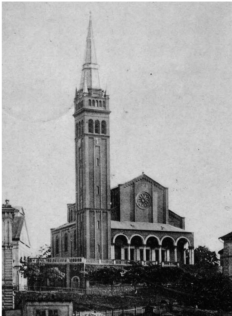
Německý evangelický kostel v Teplicích z let 1861-64 na pohlednici z počátku 20. století. Po druhé světové válce byl předán ČČS(H), dnes zpustlý.