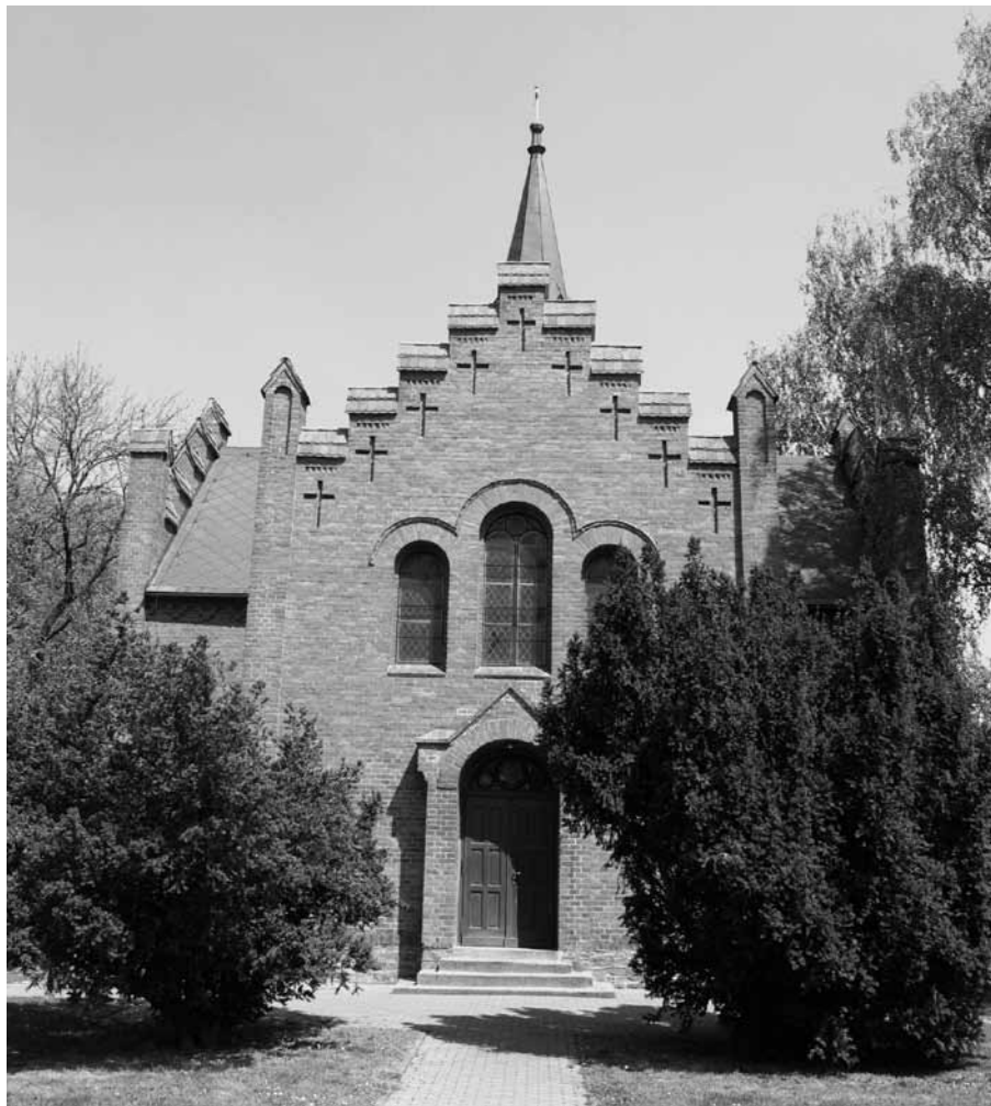
Hlučínský kostel z roku 1930 byl po roce 1989 opraven a adaptován na polyfunkční městskou síň. Okolní hřbitov byl již v roce 1965 přeměněn na park.