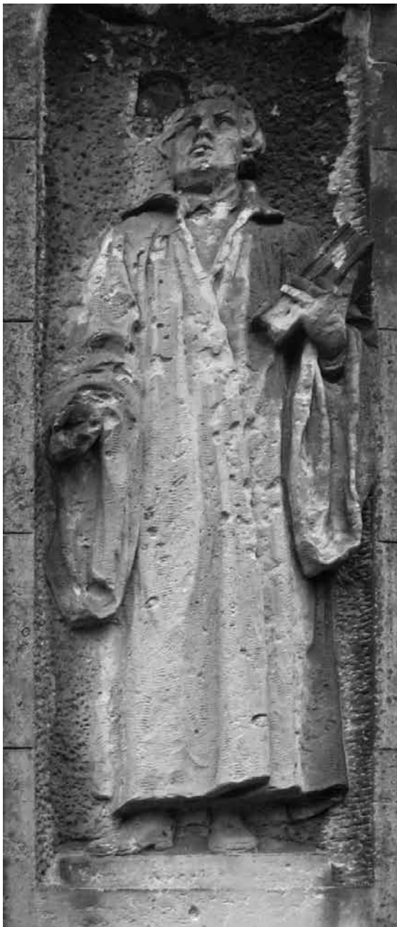
Reliéf Martina Luthera na secesním kostele v Hrobu (Klostergrab) z let 1900–1902. Po druhé světové válce byl kostel předán ČČS(H), dnes je zpustlý. Foto Z. R. Nešpor, 2009.