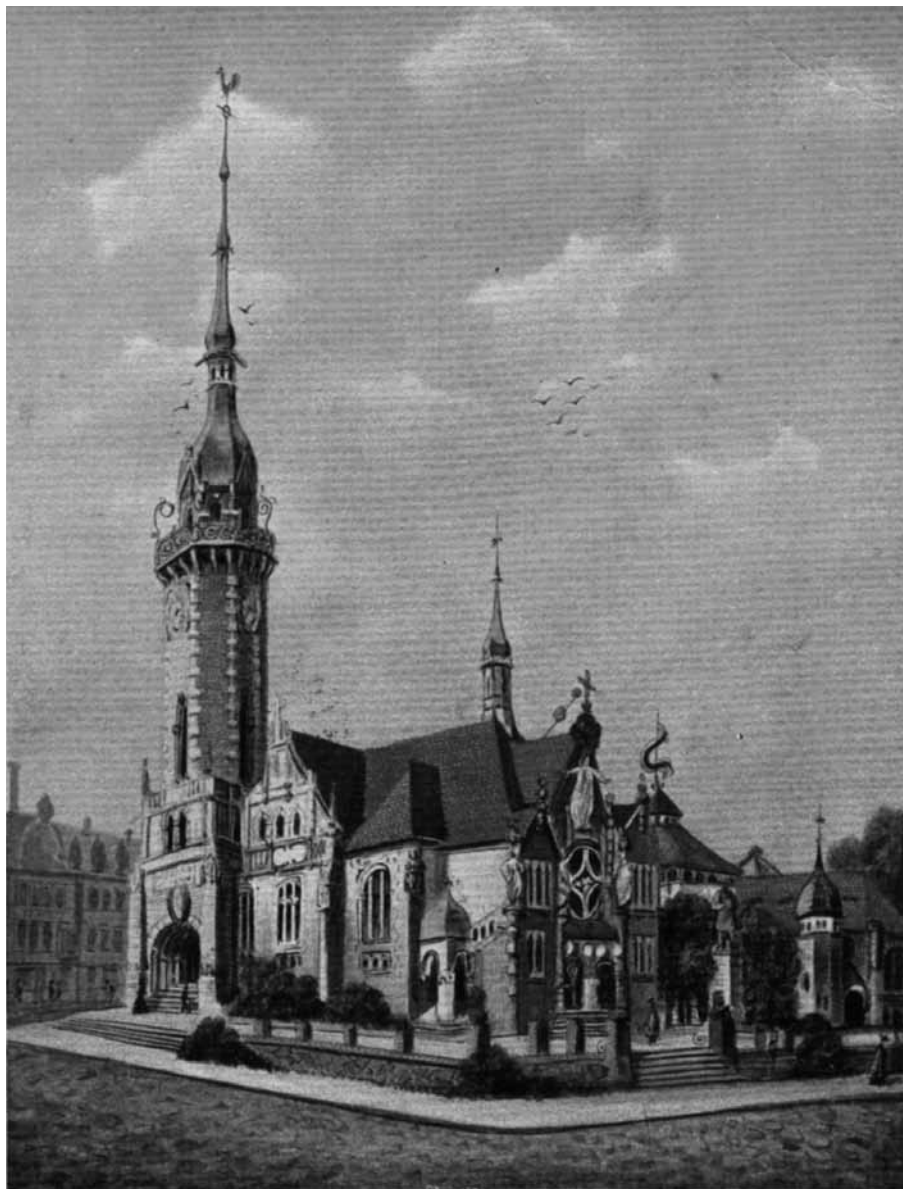
Secesní „Zelený kostel“ v Trnovanech (Turn; dnes součást Teplic) z let 1899–1905 na pohlednici z období těsně po dokončení. Po zániku NEC nebyl užíván, pak sloužil jako skladiště a v roce 1974 byl odstřelen.