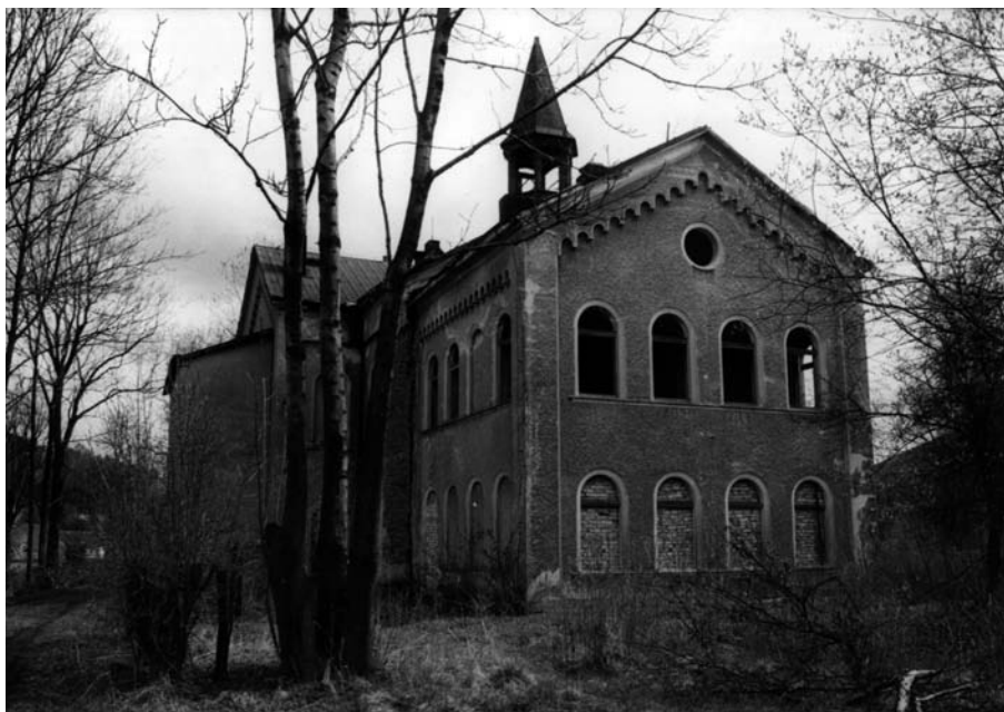
Sborový dům v Růžové – průčelí; zadní trakt. Foto autor 2005.