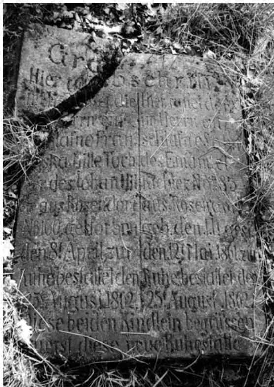
Nejstarší náhrobník na evangelickém hřbitově 2005.

člověk rozumí Písmu sám. Tradici naopak prý vůbec neuznávali, za opravdové členy církve považovali toho, kdo věří v Ježíše Krista a podle této víry také žije (Beck 1871: 12-13).