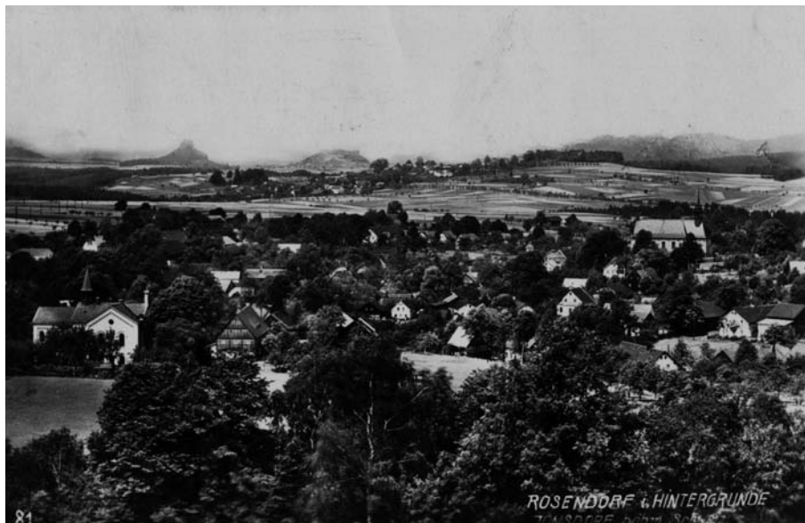
Cellkový pohled na vesnici Růžová se sborovým domem vlevo (počátek 20. století)