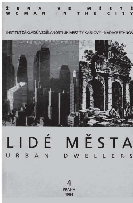
SBORNÍK LIDÉ MĚSTA / URBAN DWELLERS Z POLOVINY DEVADEŠÁTÝCH LET.