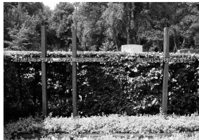
Hroby Sophie a Hanse Schollových a Christoph a Probst na Perlachovském hřbitově v Mnichově

vi a Sophie umožněno setkat se krátce s rodiči. V 17 hodin jsou Hans Scholl, Sophie Scholl a Christoph Probst popraveni. O dva dny později jsou za dohledu gestapa pohřbeni na Perlachovském hřbitově v Mnichově.