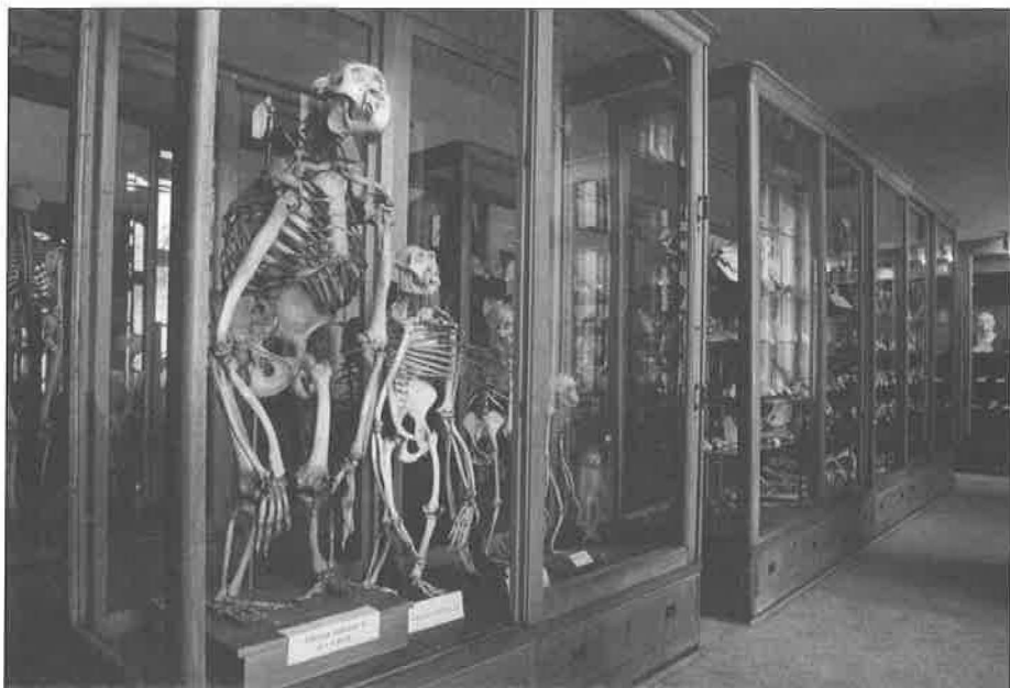
Pohled do Hrdličkova muzea člověka UK