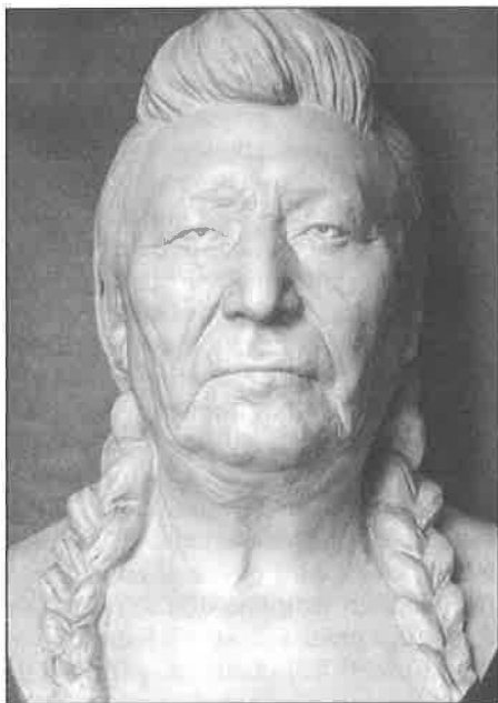
Odlitek podoby severoamerického Indiána, součást kolekce z darů A. Hrdličky