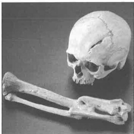
Exponáty paleopatologické sbírky