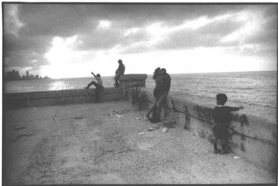
Havana, 1998.

do Bejúcalu a britští inženýři uskutečnili její výstavbou plán kubánských producentů cukru spatřujících v železnici optimální prostředek pro dopravu nákladů z vnitrozemí k přístavním molům, odkud odvážely americké a britské lodi cukr, a v menší míře i kávu a tabák, na světový trh. Rostoucí podíl černošského obyvatelstva v celkové populaci ostrova však přitom stále víc zneklidňoval mluvčí kreolské komunity. Obávali se opakování událostí v bývalé francouzské kolonii v bezprostředním sousedství Kuby, kde povstání otroků úplně zlikvidovalo nejen vrstvu bílých plantážníků, ale veškeré bílé obyvatelstvo. Hovořili a psali o hrozbě „barbarizace“ kreolské kultury i v případě, že by k podobné explozi nedošlo. Znepokojovala je tendence, kterou zaznamenal americký editor slavného Humboldtova spisu o Kubě počátku 19. století John S. Trasher. Ten v padesátých letech psal o odchodu svobodných barevných popř. uprchlých otroků do velkých měst, tedy hlavně Havany, v jejichž anonymním prostředí posilovali společenskou vrstvu pohybující se na hraně či za hranou zákona. Ve stejné době se rozšiřovala „barevná“ škála obyvatel Havany příchodem první vlny tzv. „smluvních dělníků“. Od roku 1847 je úřady přivázely k práci na plantážích z Číny a po vypršení kontraktu konstatovaly jejich přesun do měst. V Havaně tak brzy vznikla čínská čtvrť s množstvím levných jídelen, prá-