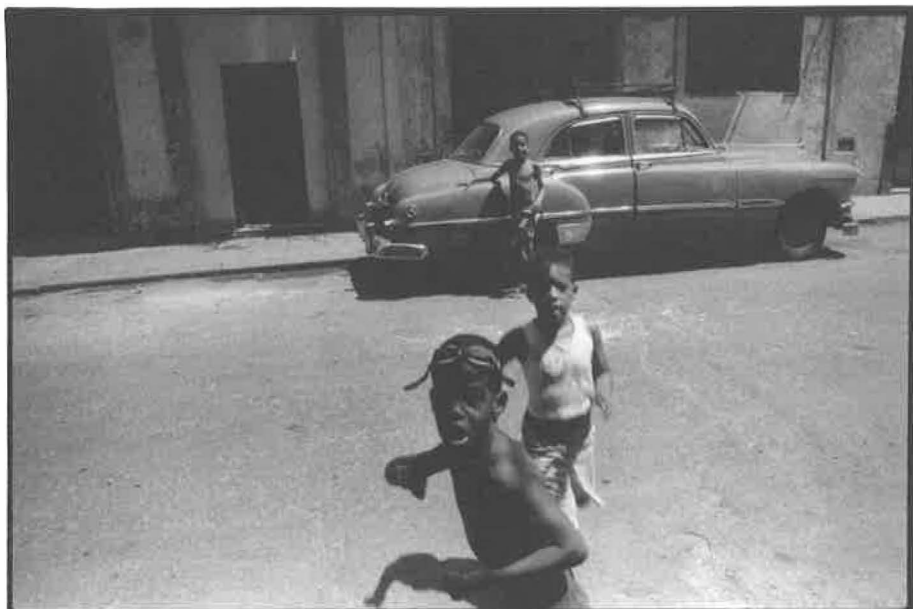
Havana, 1998.

dvou směrech. Cukrovary potřebovaly obrovské množství paliva a plantáže rostoucí množství pracovních sil v podobě černých otroků. Jejich počet stoupal i v havanských palácích plantážníků svěřujících provoz svých statků na venkově úředníkům a žijících po větší část roku buďto v Havaně nebo v evropských metropolích. Stále víc cukru směřovalo přitom na světový trh bez španělských prostředníků, což odporovalo koloniálním zákonům. Potřeby kubánských statkářů v oblasti dovozu otroků pokrývaly obchodní domy z Britských ostrovů. Británie proto jevila o Kubu, resp. Havanu, stále větší zájem, který vrcholil útokem a obsazením města v závěru sedmileté války. Několikaměsíční okupaci na přelomu let 1762–1763 pak považuje kubánská historiografie za mimořádně významný faktor dalšího rozvoje města a ostrova vůbec. Producenti cukru navázali během této doby pevné kontakty s britskými partnery a třebaže Británie podle paragrafů pařížského míru Havanu Španělsku vrátila, přinesla okupace velký impuls rozvoji plantážního hospodářství v havanské oblasti.