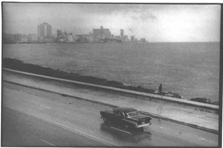
Havana, 1998.

městského centra inzerovaly americké turistické kanceláře jako Monte Carlo Ameriky, přičemž právě tato zařízení turistického průmyslu stála za plánem likvidace valné části Havany vybudované mezi starým městem a Vedadem v prvních desetiletích 20. století. Přímo nad Malecónem měla být postavena řada mnohapatrových hotelů, které by přispěly výrazně k diverzifikaci kubánské ekonomiky založené stále na exportu třtinového cukru. Miliónová Havana se měla stát městem služeb všeho druhu, ale k realizaci plánu nakonec nedošlo.