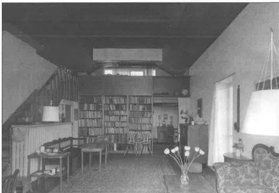
2. Celistvý prostor prvního patra rodinného domku. Nahoře otcova pracovna, pod ní za knihovnou ložnice rodičů.

Nahoře nad ní otcova pracovna. Knihovna, to bylo naše. Všechno tam bylo ušlechtilý. A byl tam takovej řád, kterej byl vlastně úplně laskavej, mírnej, ale byl tam řád. To bylo velice krásné, bráchovi to myslím velice dobře vyhovovalo, moh se tam věnovat studiu. Se mnou to bylo těžké, já jsem byl astmatik, se mnou to vždycky tak jako skřípalo. Ale brácha byl vcelku zdravěj a ten domov byl nesmírnej.