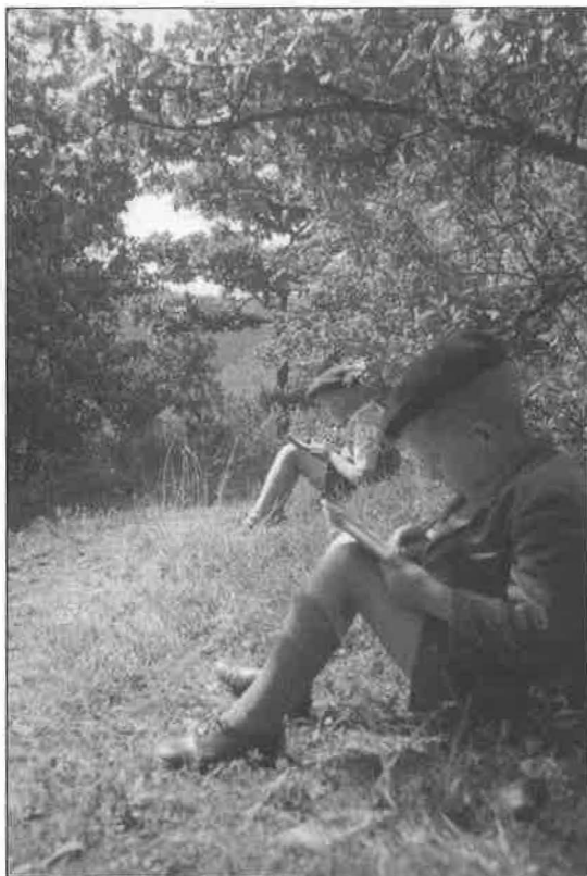
4. Při výletu s rodiči kolem roku třiačtyřicátého kreslíme Karlštejn. Kdo je kdo?

Brácha má myslím úžasnou schopnost, že nejenom ty věci nezapomene, ale oni se mu navzájem propojej. Má vhled do věcí jak po teoretický i po praktický, manuální stránce. Myslím, že k tomu přispěl i ten bolševik, když ho do tohodle všeho namočil. Mě pustili na střední školu a já jsem se cejtil trochu provinilej, že jsem vlastně kolaborant. Brácha jezdí s dvoukolákem a já si chodím na školu. Udělal jsem si pak pár průšvihů, abych to trochu zahladil.