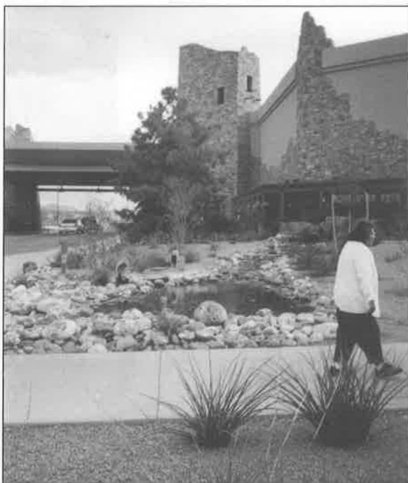
Stylizovaná stavba kasina severoamerických indiánů v Camp Verde. „Cliff Castle Casino“ se nachází v rezervaci Yavapai-Apache. Arizona, Camp Verde 2001.