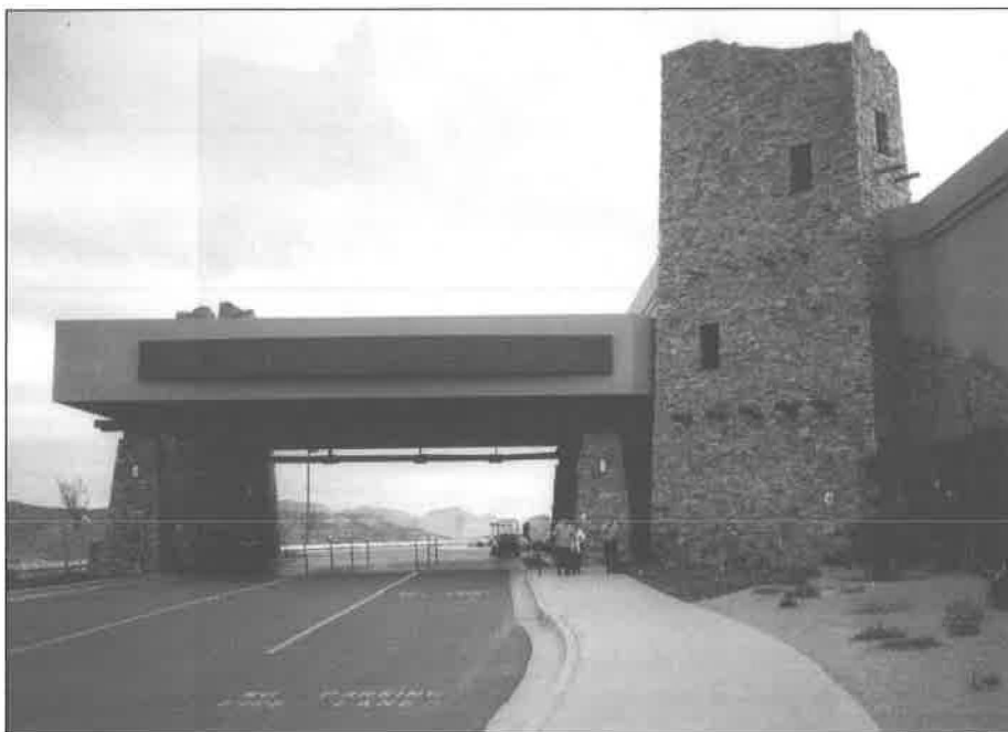
Hlavní příjezd ke „Cliff Castle Casino“. Název kasina evokuje podobnost s nedalekým národním památníkem Montezuma Castle, který je jedním z nejdochovalejších indiánských příbytků stavěných pod skalními převisy. Arizona, Camp Verde 2001.

způsobem Casino Palais Savarin nabízí svým hostům stravování v hotelu Diplomat Praha (CD Restaurant), Grandhotelu Bohemia (Restaurant „U Prašné brány“) či hotelu Adria (Restaurant Triton). Hotel Jalta, jehož je Casino Henry součástí, nabízí hned několik typů restaurací. 9