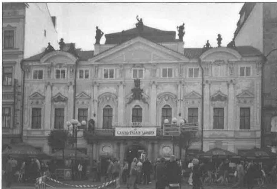
Kasino Palais Savarin. Praha 2001.

z menší části na Casino Henry) a ve dvou kasinech amerických indiánů v lednu a únoru roku 2001 (kasino Seven Feathers v Canyonville patřící kmeni Umpqua v Oregonu a Cliff Castle Casino v Camp Verde patřící javapajsko-apačskému kmeni v Arizoně). Výzkum jsem uskutečnila metodami zúčastněného pozorování, neformálními rozhovory s návštěvníky kasin (s hráči i přihlížejícími) a studiem informačních materiálů (propagační prospekty, letáky, brožury a internetové stránky vydávané pro hosty kasin). Těmito standardními metodami kulturní antropologie jsem zkoumala prostředí kasina v následujících šesti hlavních oblastech: fyzický prostor, společenský prostor, čas, hosté a personál, stav podle pohlaví a věku a národnosti. V následujícím textu kromě podrobného popisu jednotlivých oblastí analyzuji některé prvky podílející se na atraktivnosti a prezentaci kasin, které v porovnání obou zemí vystupují jako nejodlišnější. Účelem tohoto srovnání je demonstrovat, jak mohou konkrétní prvky v rámci prezentace kasina veřejnosti vést k odlišnému působení na návštěvníky těchto společenských prostor, jinými slovy k odlišnému stupni přitažlivosti a atraktivity. V závěru se zaměřuji na fenomén kasina jakožto instituce „obchodu s kulturou“, – koncept představený Richardem Kurinem