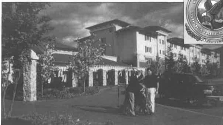
Kasino „Seven Feathers“ s logem orla.

Seven Feathers ležící v sousedství městečka Canyonville se skládá z hotelu, bazénu v atriu, fitness centra, dárkového oddělení, kabaretu, restaurace, salonku, prodejny zmrzliny a místností pro kulturní a společenské akce, jako jsou podnikové večírky, obchodní schůzky, konference apod. Jinými slovy toto středisko je samo o sobě jakýmsi „městem“, v jehož středu se nachází herní zařízení.