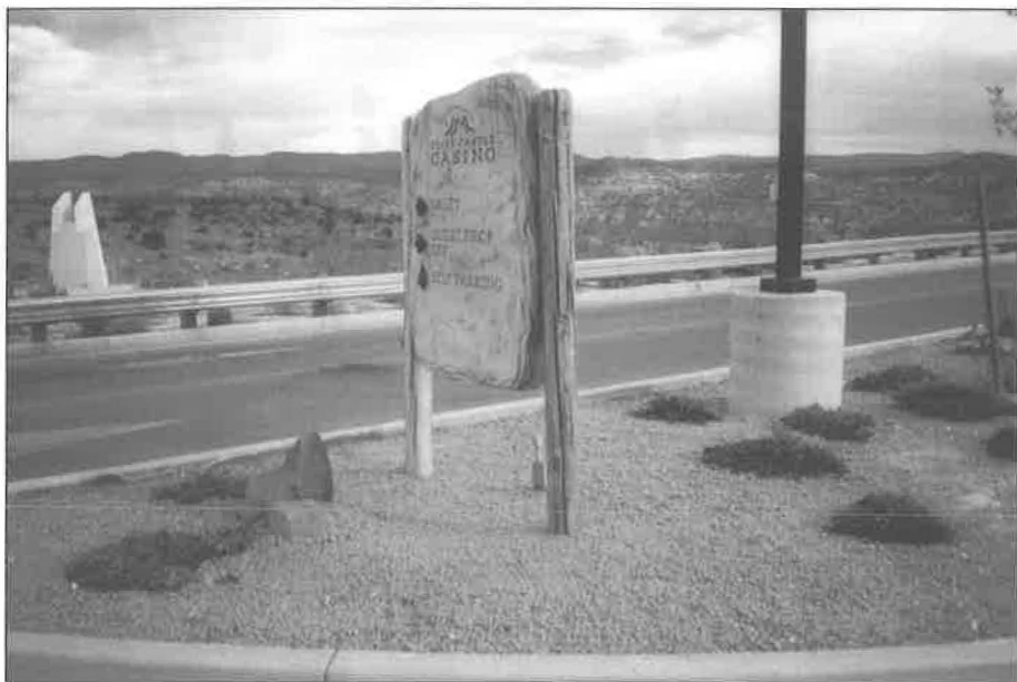
Polopouštní ráz krajiny, která patří severoamerickému indiánskému kmeni Yavapai-Apache. Detail na stylizovanou informační ceduli patřící ke „Cliff Castle Casino“. Arizona, Camp Verde 2001.

v článku Brokering Culture 4 – a na fenomén kasina jako „kulturního cíle“, jak jej definuje Barbara Kirshenblatt-Gimblett ve své knize Destination Culture . 5