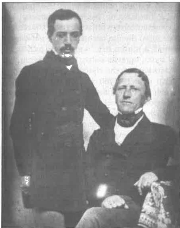
František Palacký a syn Jan Palacký Fotografie kolem roku 1860

domil, že stará města v Čechách a na Moravě se svými podloubími měšťanských domů byla mnohem podobnější italským městům než městům v Německu, ovšem v nové době se podobné stavby v Čechách postupně vytrácely. Tento poznatek vedl Palackého k úvaze, zda Itálie neměla mnohem větší vliv na vnitřní utváření Čech ve středověku, než se dosud běžně předpokládalo. Po překročení hranice papežského státu na řece Pádu sledoval Palacký pozorně města, v nichž se bývalý přepych prolínal s novodobou chudobou. Obrovský papežský rychlík musel být v hornatých úsecích za Bolognou a přes Apenniny tažen šesti, někdy až osmi koňmi, na zvlášť obtížných místech připřáhli v deštivém počasí ještě dva až čtyři voly. 121