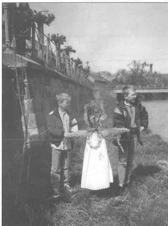
3. Zapálení smrtky u řeky. 6. 4. 2000