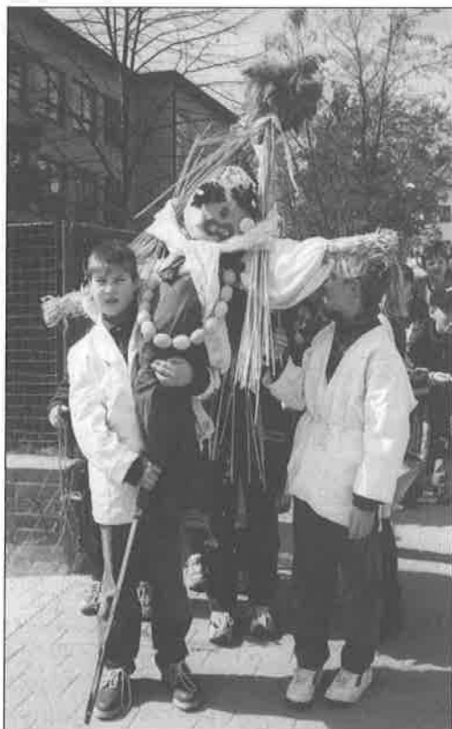
1. Děti ze školní družiny v Chlumci nad Cidlinou vynášejí smrt.

ských souborů. Teprve až devadesátá léta dvacátého století přinesla kupodivu jisté oživení a zájem o obnovení dávných tradic. Byli to především pedagogičtí pracovníci – učitelé mateřských a základních škol, školních družin a vedoucí různých kroužků v Domech dětí a mládeže, kterým bylo z vyšších míst doporučováno vracet se k starým místním tradicím. Spolupůsobila zde zřejmě i porevoluční změna školních osnov, především občanské výchovy, jejíž učebnice pro 5. – 9. třídu věnuje výročním obyčejům pozornost a seznamuje žáky s jejich průběhem v kalendářním roce celkem na patnácti stranách. 8