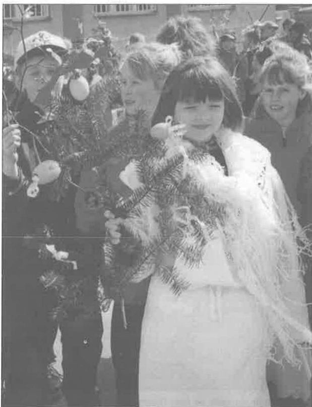
5. Děti se vracejí s lítem ke škole. 6. 4. 2000

nějí učitelky (staré sukně, trička, halenky). Chybějící součásti zhotovují z bílého krepového papíru. Stejně tak dodají dřevěné hůlky a slámu. Děti pak přinesou vyfouknuté vaječné skořápky. Záleží také na nich, jak se do průvodu obléknou. Chlapci nesoucí Moranu měli bílé širší kalhoty, někteří i bílou halenu, dívky bílé nebo pestré dlouhé sukně. Většina dětí však byla v normálním školním oblečení.