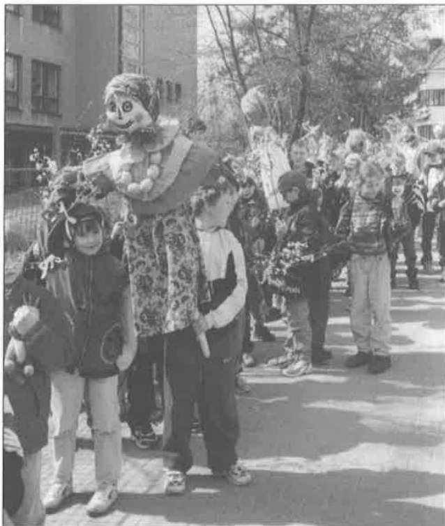
2. Děti ze školní družiny v Chlumci nad Cidlinou vynášejí smrt. 6. 4. 2000

a metodických listech, odkud byly vybírány, pocházejí z nejrůznějších sbírek lidových písní, dokonce i moravských (např. Erben, Bartoš aj.).