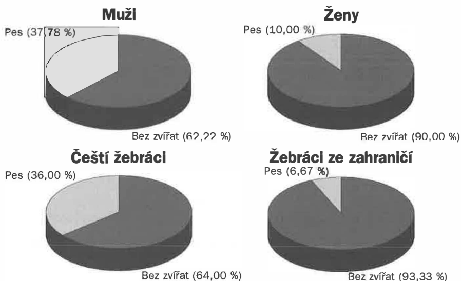
Obr. 5: Přítomnost zvířete při žebření: a) muži a ženy, b) češi a cizinci.

z postižených svoje onemocnění jenom předstírají. Například, rumunské ženy často sedí na zemi a mají vystavenou jednu nohu. Druhou mají skrčenou pod sukni a sedí na ní, aby vznikl dojem, že jsou invalidé. Někteří žebráci mají obvázané končetiny gázou, ale nikdo neví, jestli jsou doopravdy zranění. Ovšem ti, kteří mají nějaký handicap, se ho snaží nejvíc ukázat – chybějící končetiny, úrazy, jsou na vozíčku, slepí atd.