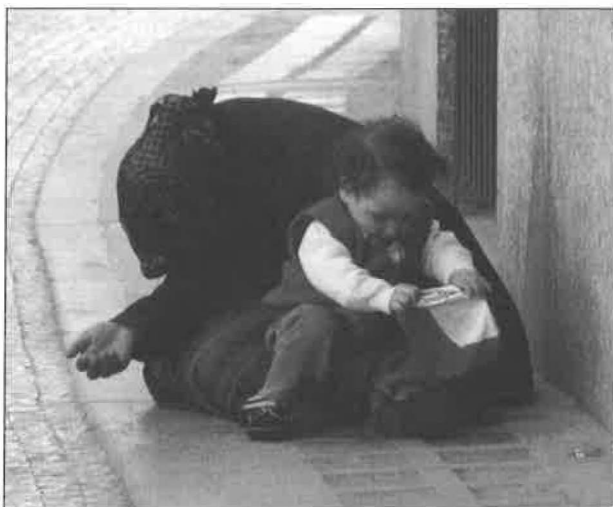
Obr. 1: Žebrající matka s malým dítětem – cizinka.

v menším počtu. Kromě Prahy jsme zaznamenali žebráky v Brně, Liberci, Ústí nad Labem, Olomouci. V několika menších městech byli žebráci především na autobusových nebo železničních nádražích (Kunvald, Hradec Králové, Sušice, Jičín, Frýdek-Místek, Kralupy).