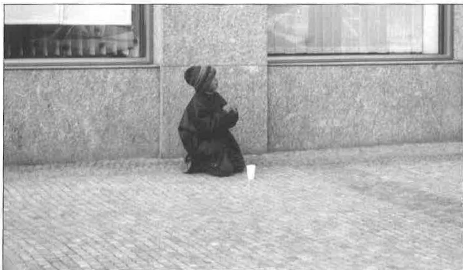
Obr. 6: Žebrající rumunské dítě.

vozu snižuje úspěšnost, protože lidé na žebrající dobře nevidí, spěchají a nemají moc možností se zastavit.