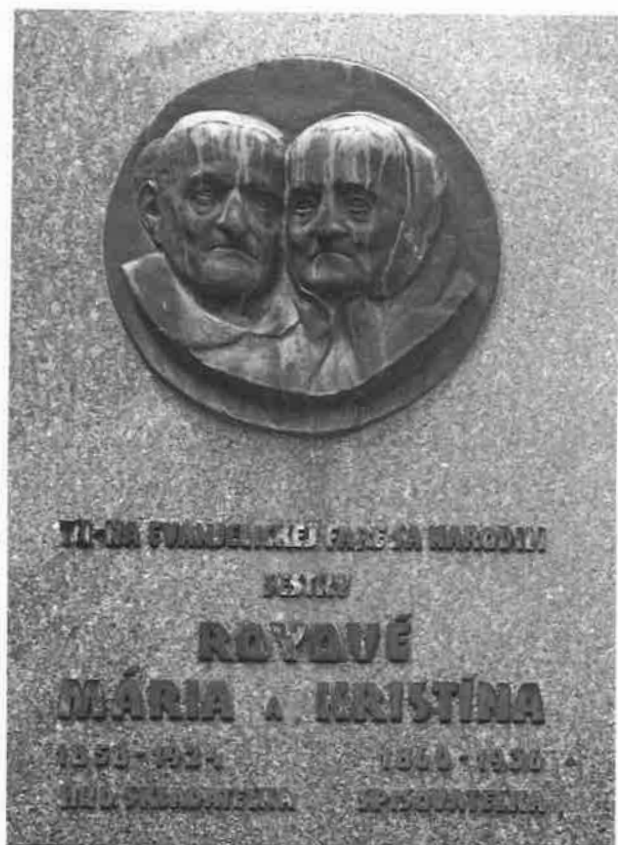
Pamětní deska sester Royových ve Staré Turé. 2010.

metodistická episkopální církev (dále jen EMEC) (Mojzes 1965). Následně přichází kazatel vídeňského metodistického sboru Martin Roháček, původem ze Staré Turé. Nyní, když se dostáváme k příběhu „ve Vojvodovu“, ohlédneme se na chvíli zpět na Svatou Helenu, abychom se zastavili u širších souvislostí misí probuzeneckého hnutí a naznačili zásadní význam probuzenectví pro hledaný obsah víry vojvodovských Čechů, neboť se jedná právě o skupinu svatohelenských obracených odcházející z banátské Svaté Heleny do bulharského Vojvodova, které spoluzakládají.