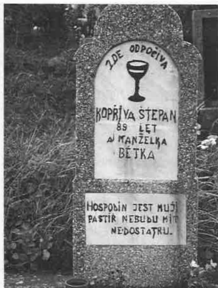
Evangelické náhrobky na Svaté Heleně. Foto M. Pavlásek, 2009.

vycházejících. V našem případě díky takovéto argumentaci můžeme pochopit a vysvětlit například náboženský rozkol ve Vojvodovu, kde se již „obrácená“ část sboru dlicí pod pláštíkem církve metodistické, jež zde působila jako jedna z větví probuzenectví zprostředkovaného střední a jihovýchodní Evropě misíí Americké (kongregační) a Britské (presbyteriální) církve, opět dělí dle totožného principu jako při vymezení částí reformovaného sboru na Svaté Heleně na věřící a nevěřící . 23 Onen rozkol můžeme nazírat optikou M. Jakoubkem navrženého „strukturálního repete“, které užil pro výklad i jiných událostních souvislostí (Jakoubek 2010: 535, 544).