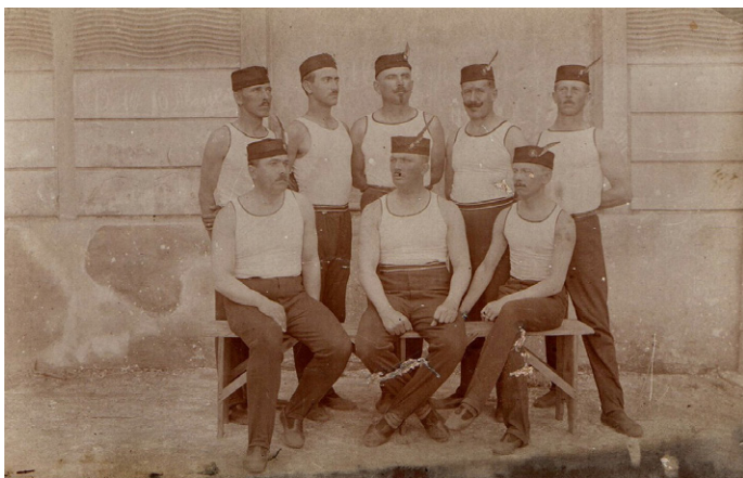
Členové Sokola v Gorné Orechovici, 1921.