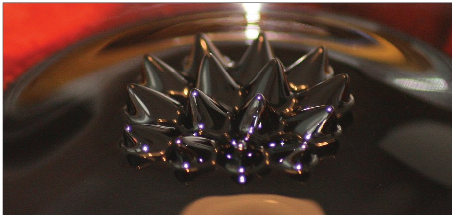
Obr. 2. „Ježek“, kterého vytvoří magnetická kapalina po přiložení magnetu

S magnetickými indukčními čarami se žáci setkají již v 6. ročníku na základní škole, kde pomocí řetězců pilin zobrazují magnetické pole na podložce položené na magnetu. Problém je v tom, že piliny nám umožňují zobrazit jen ty čáry, které leží v rovině podložky. Jelikož indukční čáry můžeme určovat v celém prostoru magnetického pole, je potřeba i prostorové zobrazení. To mohou učitelé poskytnout i magnetické kapaliny obsahující nanočástice na bázi železa. Toto dynamické místo kurikula je provázáno se stávajícím fyzikálním kurikulem