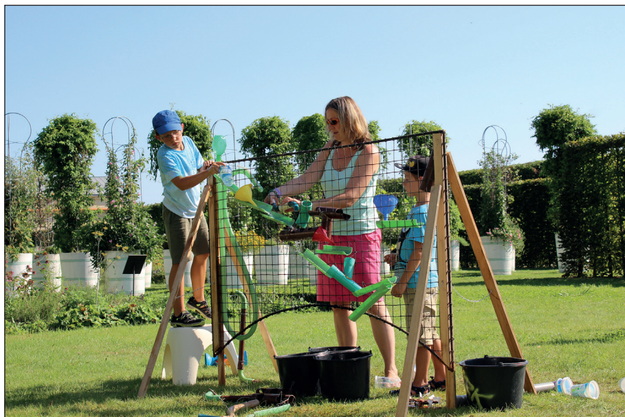
Obr. 4. Rodiny sestavovaly v zahradě vodní stroj

s důmyslným vodním strojem, který dokázal nečekaně smáčet návštěvníky. Protože dnes již takto nefunguje, připravili lektori návštěvníkům příležitost jednak osvěžit se vodními tryskami v zahradě a jednak sestavit vlastní vodní stroj za pomoci sady plastových lahví, hadiček, vodních mlýnků aj. (obr. 4). Aktivita opět přinesla velkou radost celé rodině a příležitost k vyučovacím chováním, mezigeneračnímu učení. Současně se při ní naplnil princip dotváření díla pomocí hry. 10