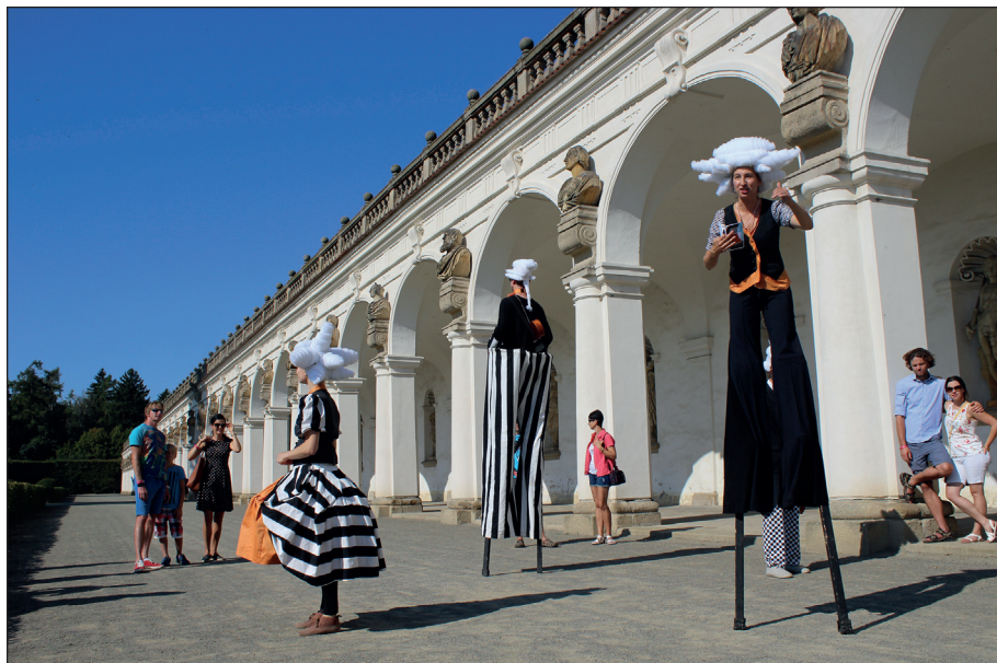
Obr. 1. Festival Hortus magicus rozvíjí v zahradě „baroko 21. století“

dětských představení a herního mobiliáře (například barokní houpačka) je to nabídka herních aktivit dimenzovaná pro zhruba pět set osob.