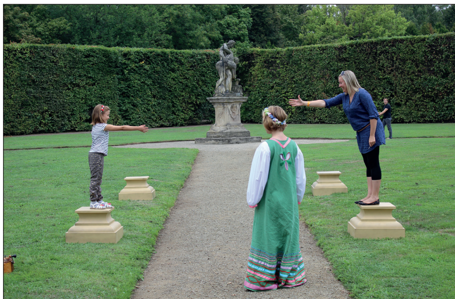
Obř. 3. Rodiče jsou plnohodnotnými účastníky mezigeneračního učení

ten zatím poslední, uskutečněný v roce 2019. 8 V témže roce vydal Národní památkový ústav knihu Tajemství Libosadu (Hudec, 2019). Jedná se o specifický formát „pohádkového či dětského průvodce po památce“, kdy je literatura prostředkem k poznávání hmotného kulturního dědictví a zároveň motivací k osobní zkušenosti z prožitku. Hlavním hrdinou příběhu je chlapec Robert, který je na prázdninách v Kroměříži u svých prarodičů. Prastaré stromy rostoucí v Květné zahradě ho přenesly do období baroka. Robert se díky tomu setkává s mnoha lidmi pečujícími o zahradu v době její-