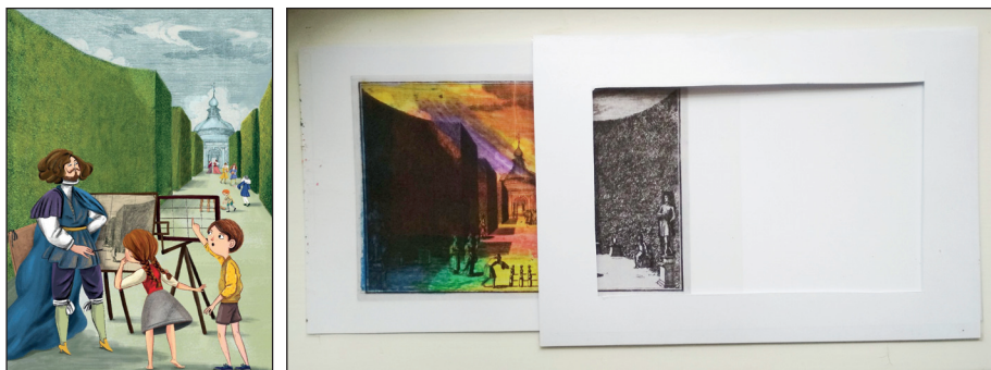
Obr. 5. Ilustrace Elišky Chytkové z knihy Tajemství Libosadu a výsledek výtvarné aktivity v zahradě v podobě posuvného obrázku